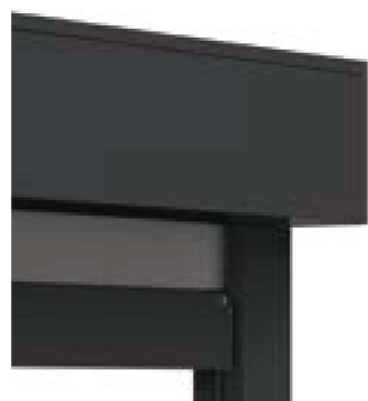
Antraciet (RAL 8019)