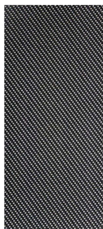
Parelmoergrijs (RAL 1035)