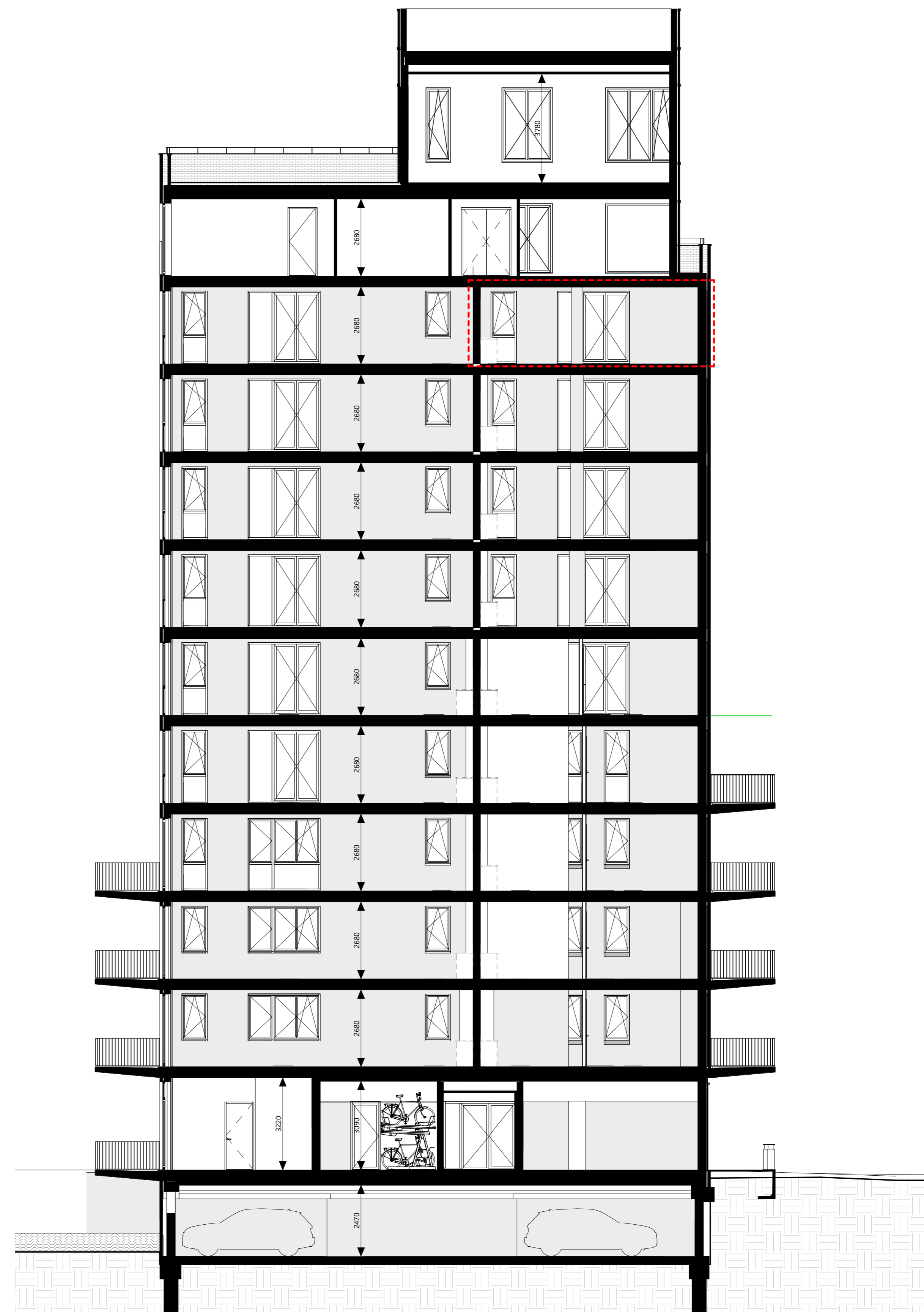
doorsnede B 1 : 100