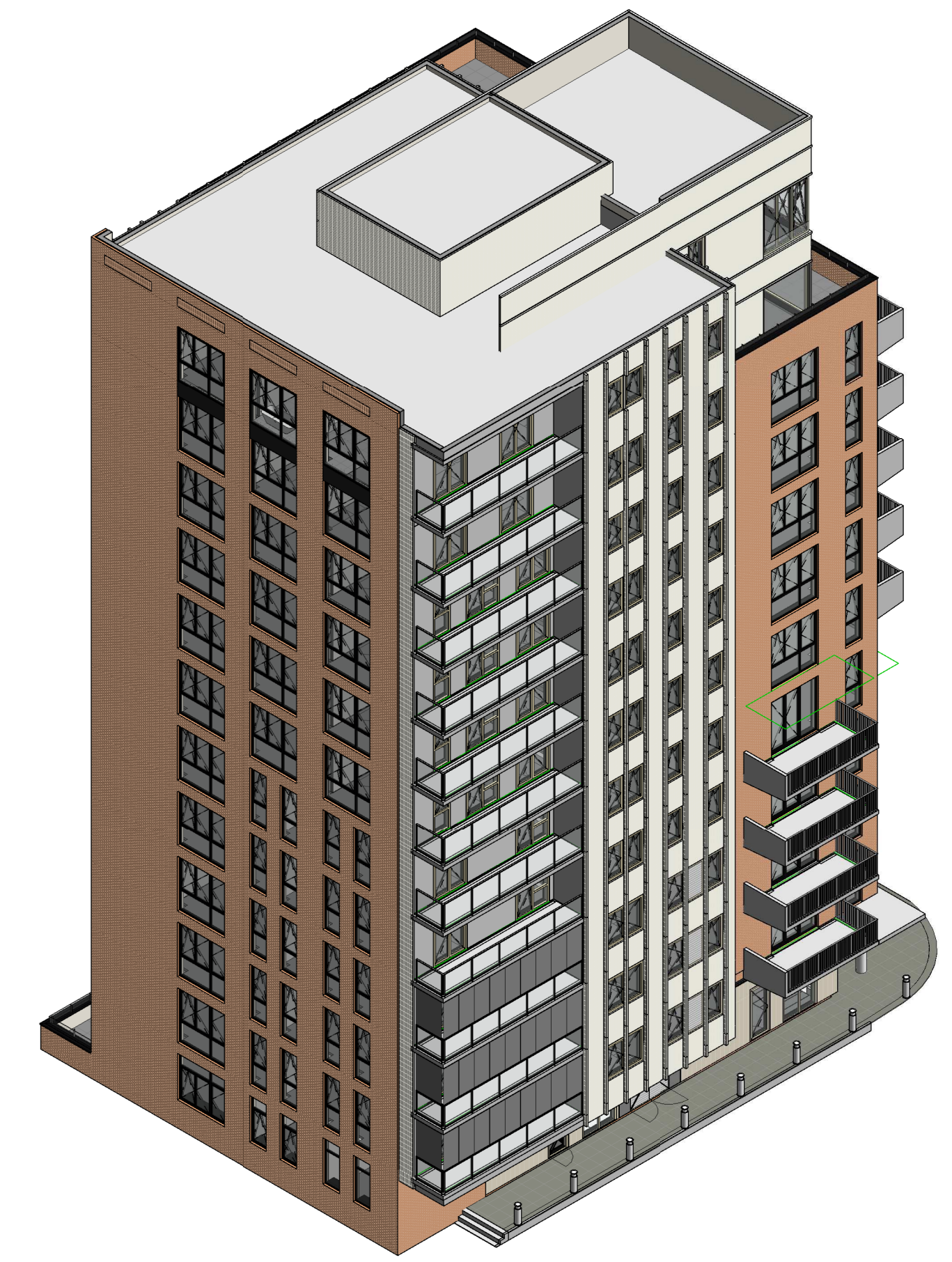
3D impressie vanaf noordzijde