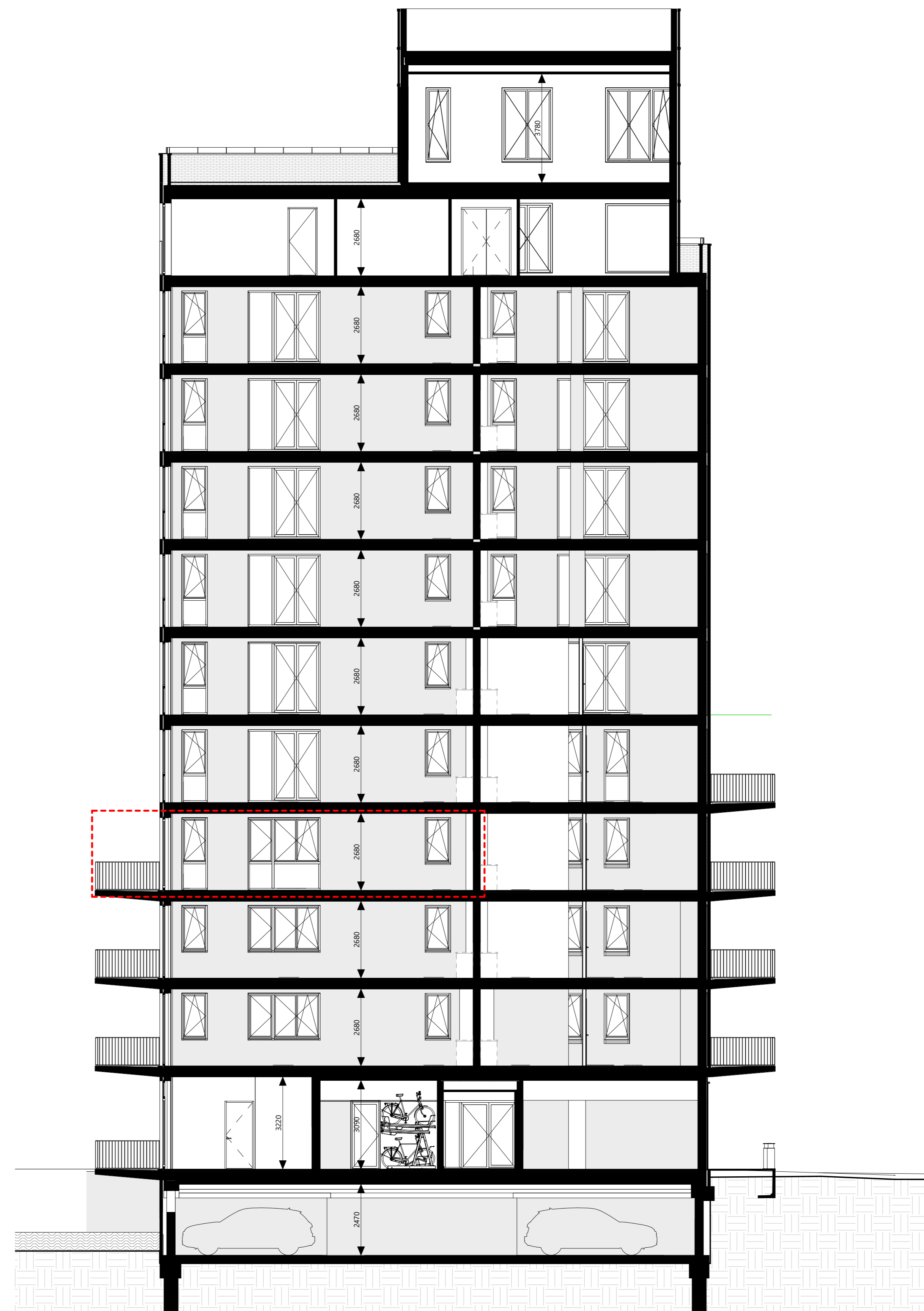
doorsnede B 1:100